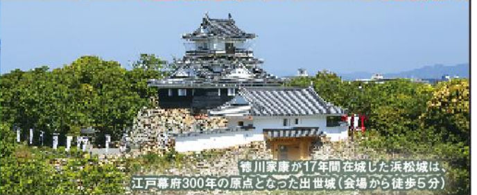
徳川家康が17年間在城した浜松城は、 江戸幕府300年の原点となった出世城(会場から徒歩5分)