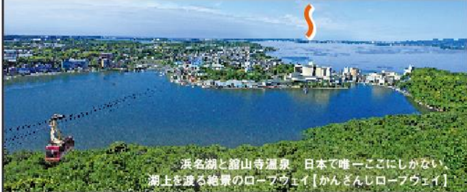
浜名湖と箱山寺温泉 日本で唯一ここにしかない 湖上を渡る絶景のロープウェイ【かんざんロープウェイ】