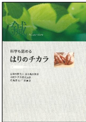
「科学も認めるはりのチカラ」