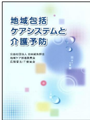
「地域包括ケアシステムと介護予防」

地域の医療・介護専門職を含めて多職種の方々に、そして患者の皆さんに鍼灸・鍼灸師の認識を高める手段としてご活用ください。