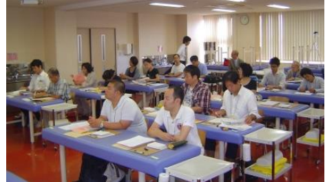
(昨年の臨床研風景)

【お問い合わせ・お申込み】 公益社団法人日本鍼灸師会 事務局 TEL 03-3985-6771